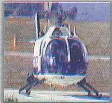
BO-105 (Helicóptero) D.G. Policía