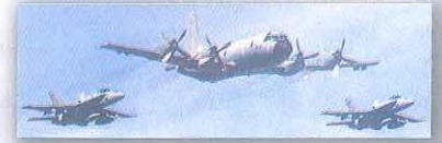
P-3 Orión en formación con F-18