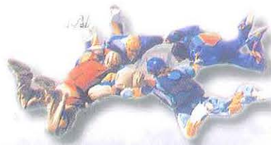
Club Paracaidismo Deportivo de Córdoba